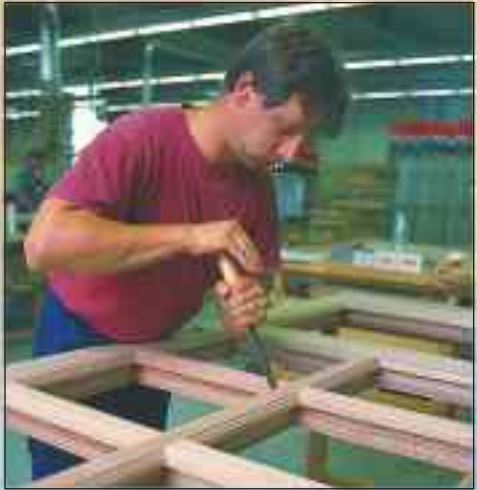
Auch bei modernster Fertigung ist handwerkliches Können Voraussetzung für höchste Qualität

Umweltschutz ist für uns lebensnotwendig, kein notwendiges Übel! So ist es kein Zufall, daß wir nach neuesten Richtlinien des Umweltschutzes produzieren, nur unbedenkliche Lasuren, Farben und Lacke verwenden. Auch die benötigte Wärmeenergie erzeugen wir selbst, um die Ressourcen unserer Erde zu schonen.