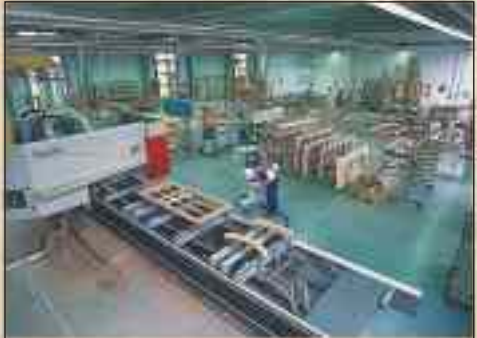
Passgenaue und flexible Fertigung durch den Einsatz modernster CNC-Technik

Hier wissen die Menschen, wie man mit Holz umgeht, es handwerklich perfekt bearbeitet und wie Holzprodukte beschaffen sein müssen, um höchsten Qualitätsansprüchen zu genügen.