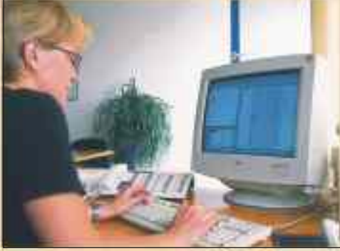
CAD-gestützte Auftragsbearbeitung und Fertigung

DIETEL Bauelemente ist ein holzverarbeitender Betrieb mit langjähriger Tradition im Herzen des Erzgebirges. Der Firmensitz befindet sich im neu erschlossenen Gewerbegebiet der Stadt Jöhstadt.